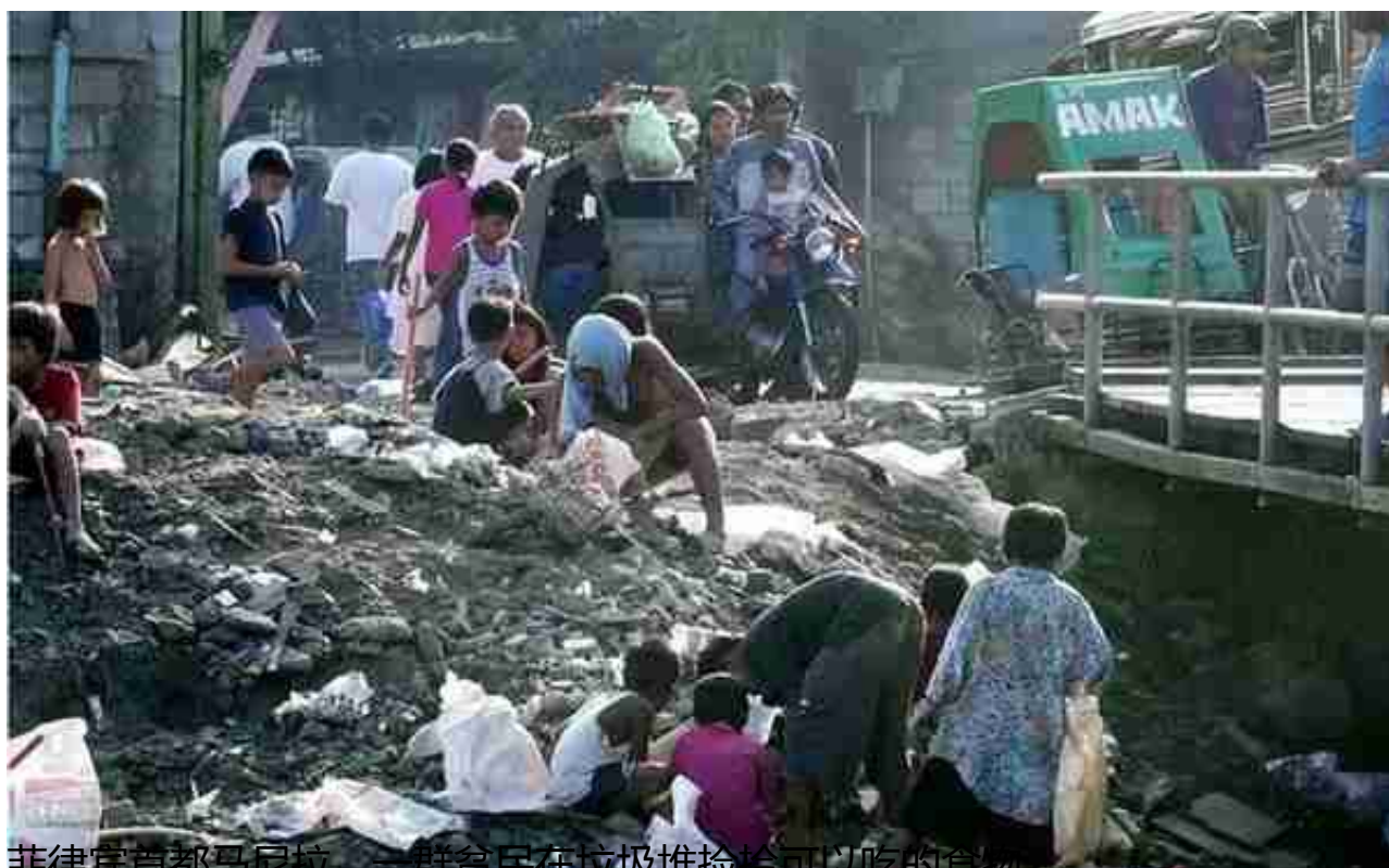
菲律宾首都马尼拉，一群贫民在垃圾堆捡拾可以吃的食物

那么，这个曾被誉为“亚洲四小虎”之一，一度是仅次于日本的亚洲第二富裕的国家，为何混到如此惨的地步呢？