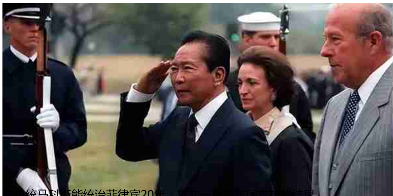
前总统马科斯能统治菲律宾20年，其实一直是美国支持的结果