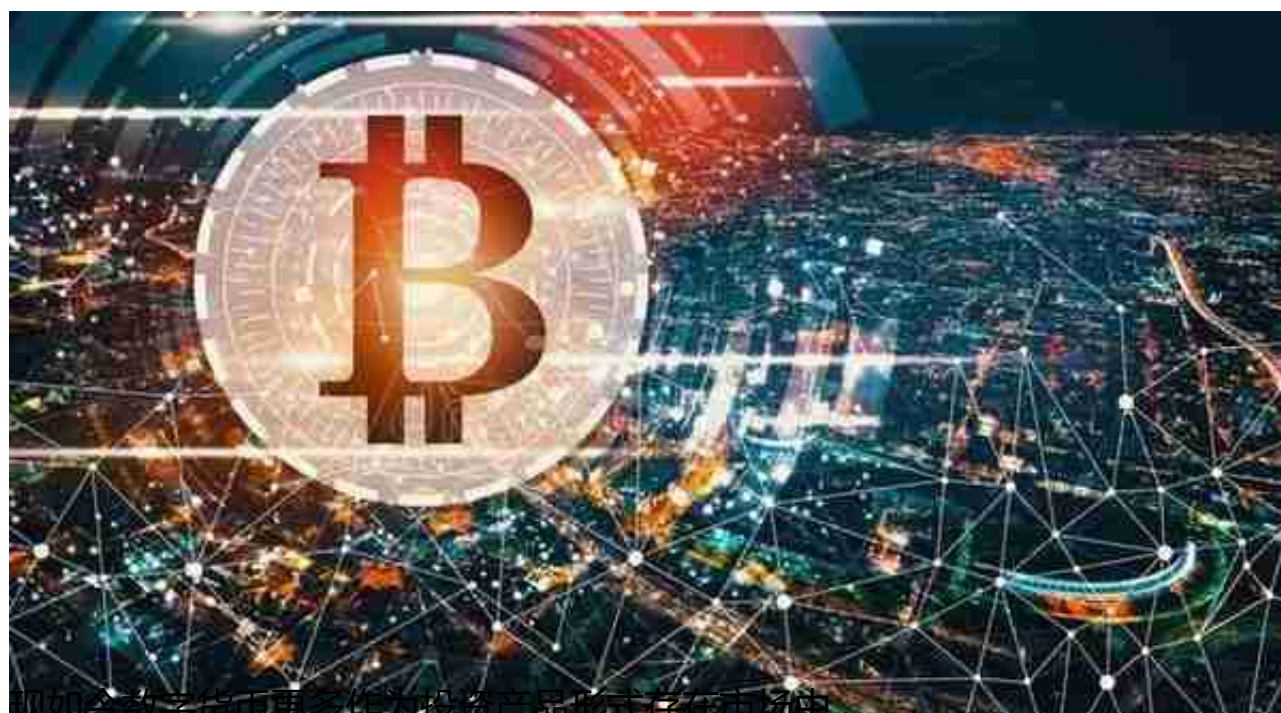
现如今数字货币更多作为投资产品形式存在市场中