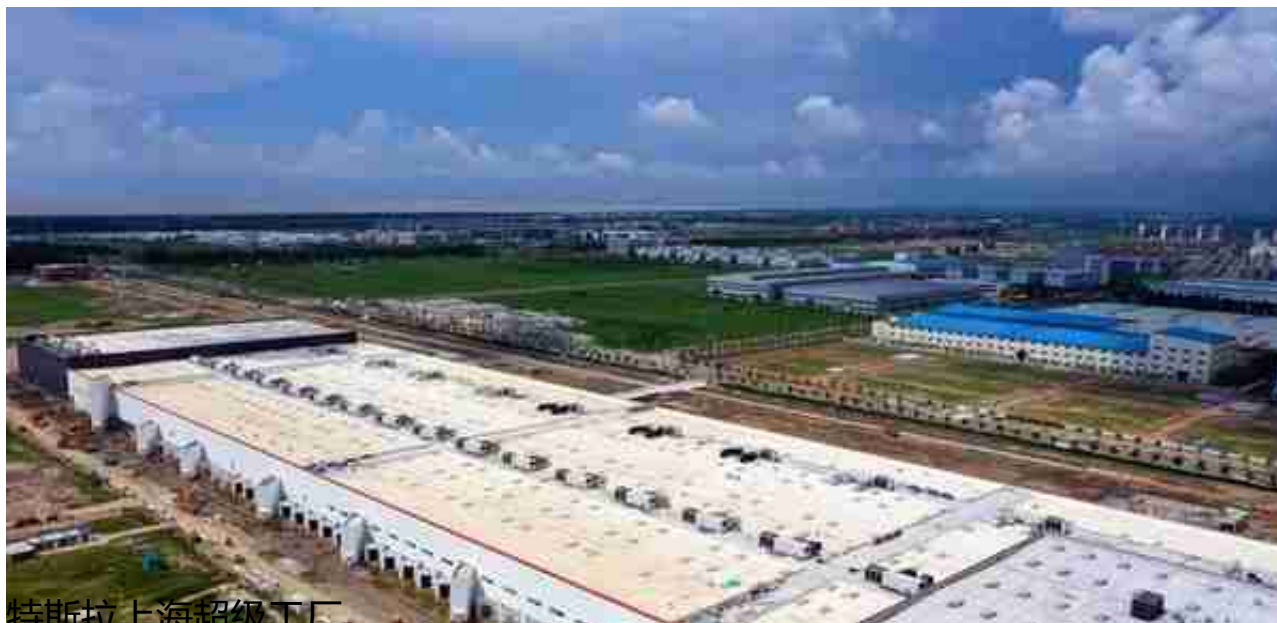
特斯拉上海超级工厂