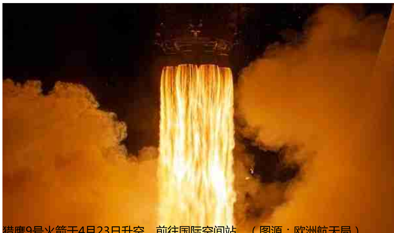
猎鹰9号火箭于4月23日升空，前往国际空间站。

马斯克在今年疫情防控期间仍试图强行让特斯拉工厂开工，他生产太阳能瓦片的公司也已经陷入经营困境，他还警告称SpaceX有可能破产。马斯克的星链计划希望发射4.2万颗卫星，但这一工程对近地轨道的占用和太空垃圾问题仍未得到有效解决，此外，他的超级地下隧道项目也被批评者指出不如普通地铁有效且公平。