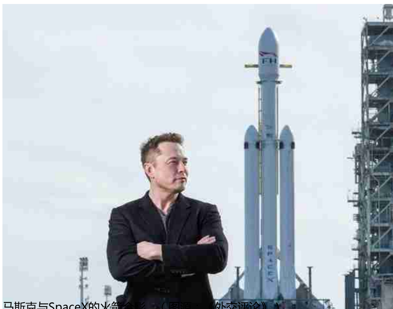
马斯克与SpaceX的火箭合影。

然而，更加精通社交媒体、又不差钱的马斯克很快就打脸了批评者们。他在12月20日公开表示，“告诉那些好奇的人，我今年将缴纳超过110亿美元的税款”。