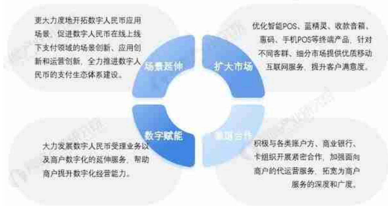
图表 10: 拉卡拉未来发展规划

以上数据参考前瞻产业研究院《中国数字人民币行业市场前瞻与投资战略规划分析报告》，同时前瞻产业研究院还提供产业大数据、产业研究、政策研究、产业链咨询、产业图谱、产业规划、园区规划、产业招商引资、IPO募投可研、IPO业务与技术撰写、IPO工作底稿咨询等解决方案。