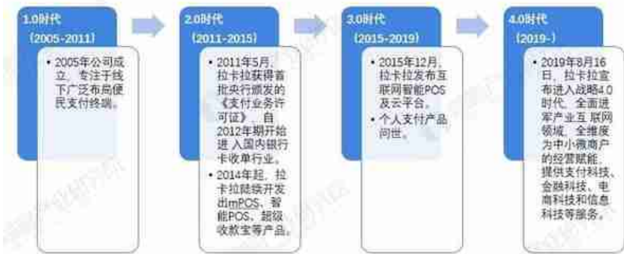
图表2：拉卡拉-数字人民币相关业务布局历程

新大陆(000997.SZ)与拉卡拉(300773.SZ)均是数字人民币领头羊，两者在电子支付设备(POS机，三方支付上游)和三方支付服务方面均有布局。具体来看，拉卡拉(300773.SZ)的在支付业务的收入较高，市场认可程度较高，且支付业务的毛利率水平具有一定优势。