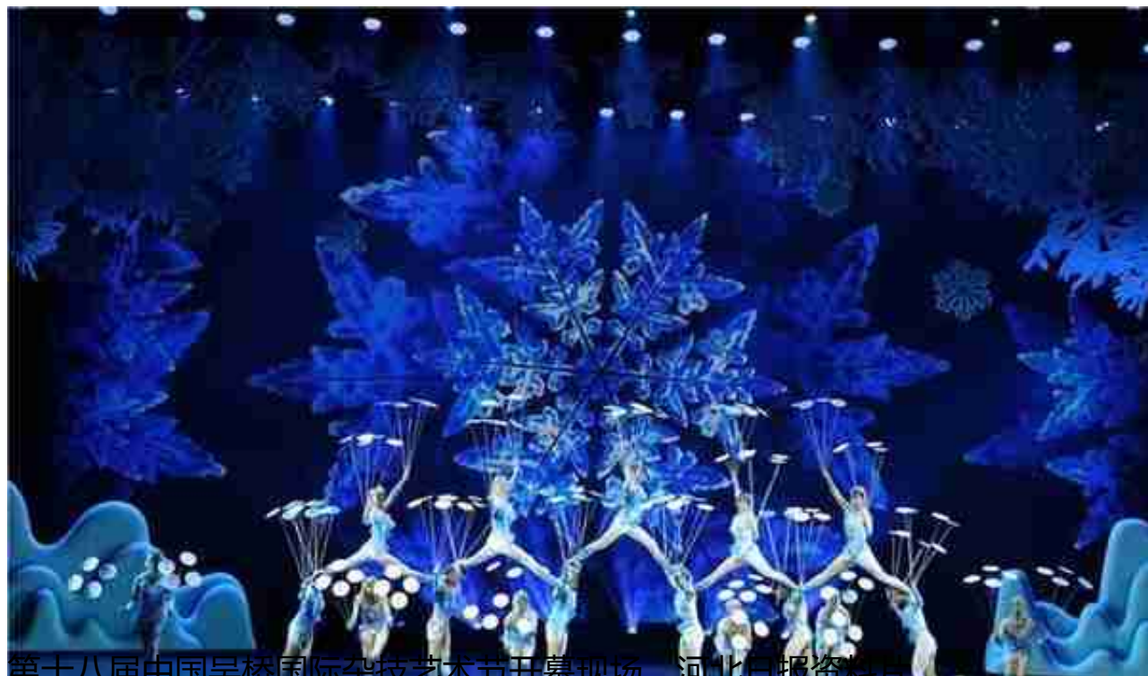
第十八届中国吴桥国际杂技艺术节开幕现场。