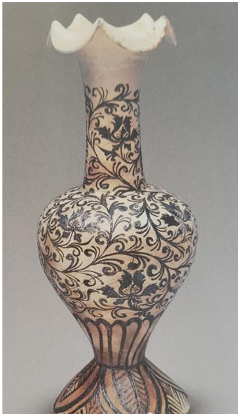
金代磁州窑白地黑花缠枝牡丹纹花口瓶。